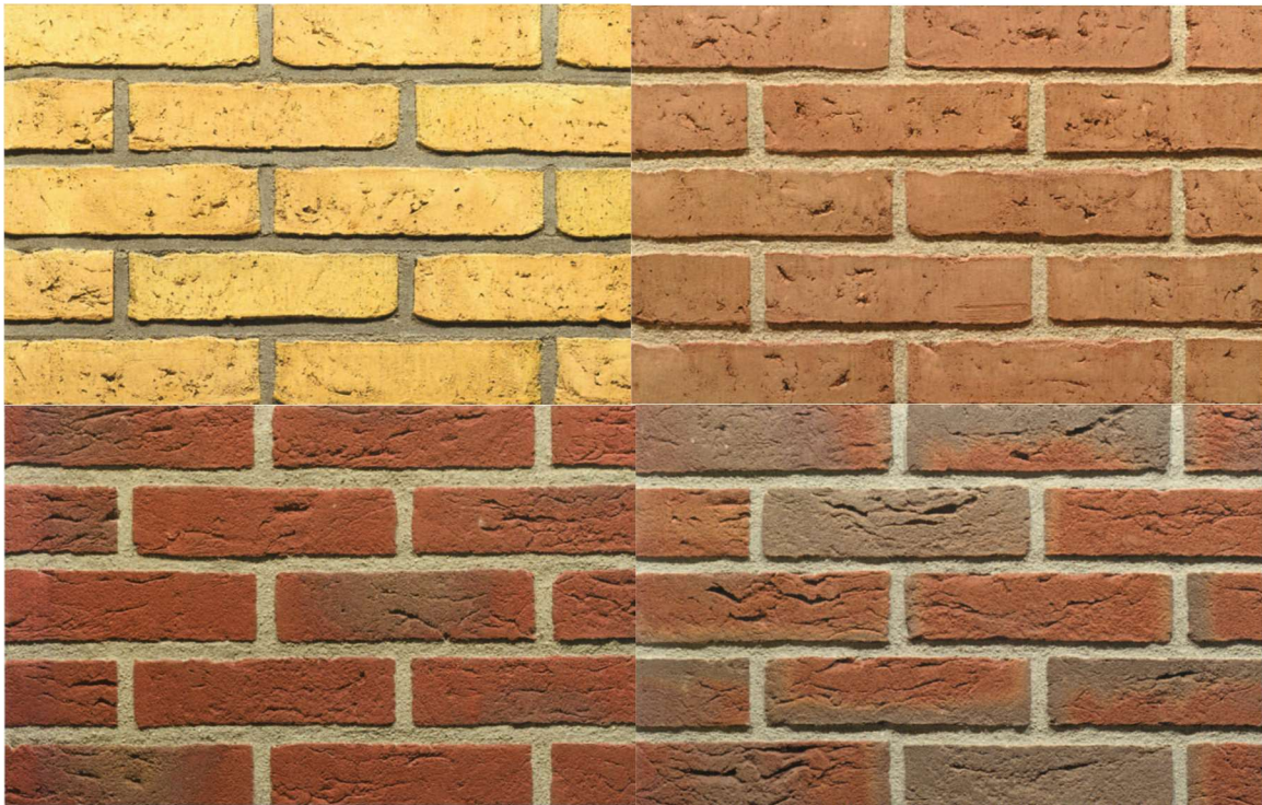
kleurenpalet: geel tot rood-bruin