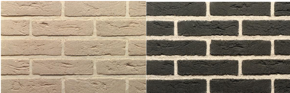
kleurenpalet accenten: wit en antraciet / zwart