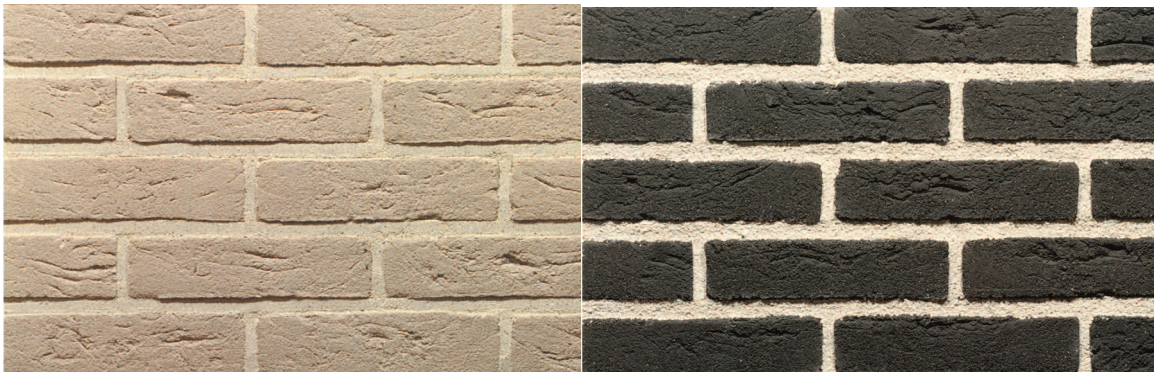
kleurenpalet accenten: wit en antraciet / zwart